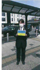
ウクライナ募金 トルコ地震募金