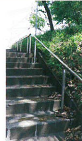
旭が丘5丁目 手すり設置