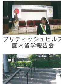
プリティッシュヒルズ 国内留学報告会